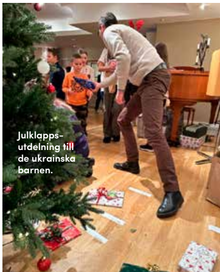
Julklapps- utdelning till de ukrainska barnen.

Inför jul kunde vi dessutom dela ut julklappar till alla barn och ungdomar från Ukraina. Ibland gör vi aktiviteter som vandringar, samtalskvällar och liknande där vi berättar om Sverige. Vi har också ett