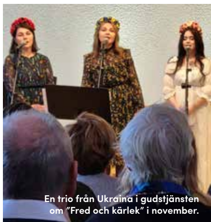
En trio från Ukraina i gudstjänsten om "Fred och kärlek" i november.