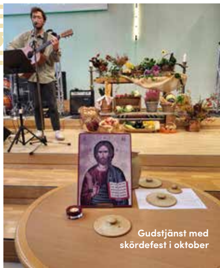
Gudstjänst med skördfest i oktober