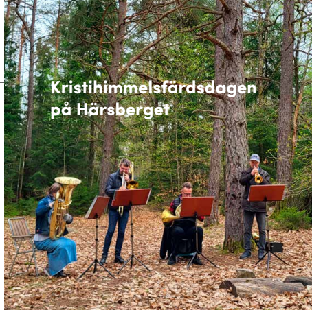
Kristihimmelsfärdsdagen på Härserberget