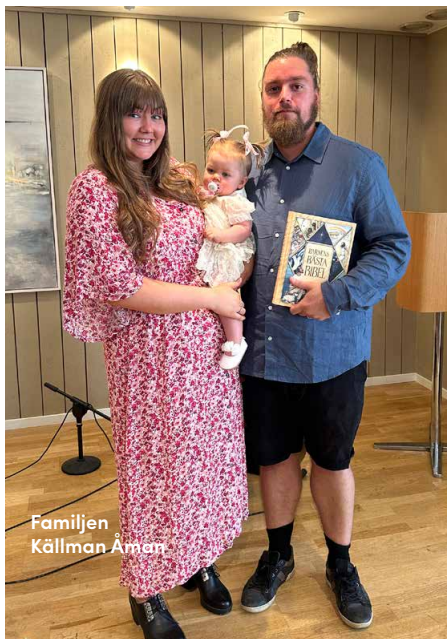
Familjen Källman Åman